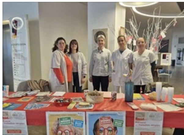
Clinique Francheville (24)