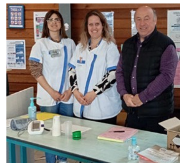
Centre Néphrocare à Aressy (64)