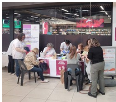
CH d'Agen-Nérac aux centres Leclerc de Villeneuve sur Lot et Intermarché d'Agen (47)