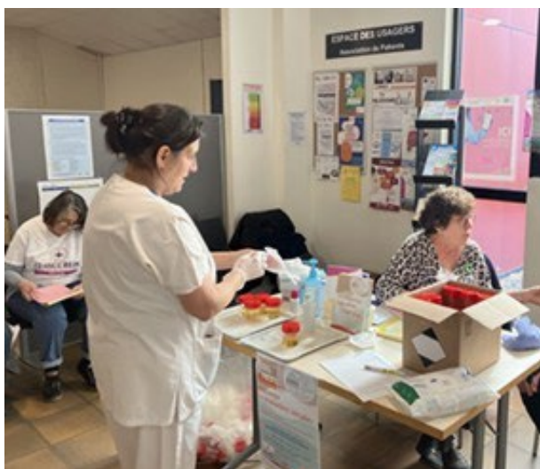
Maison du Rein AURAD Aquitaine au CH de Langon (33)