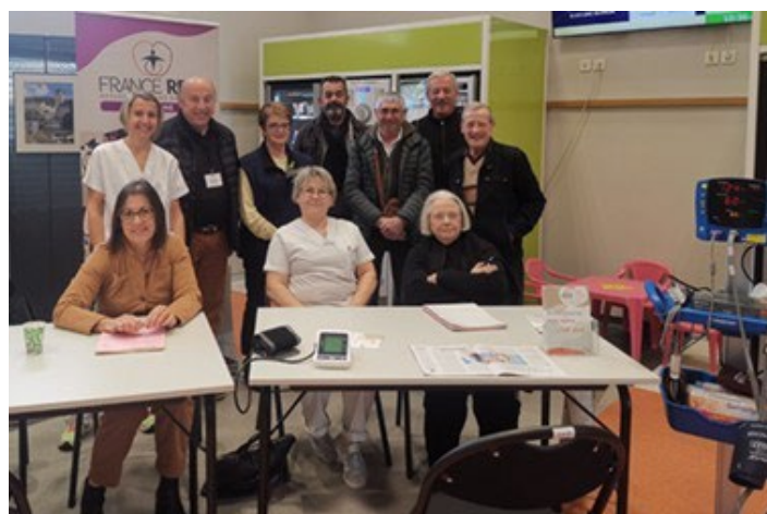
CH d'Oloron (64)