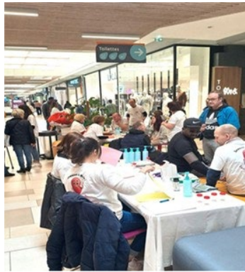
Groupe Elsan à Auchan Bordeaux Lac (33)