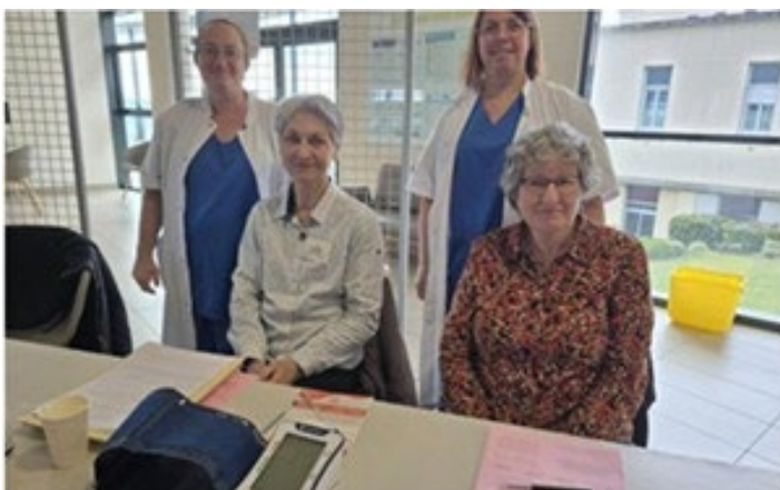
Coordinatrices au CH de Périgueux (24)

Nous remercions tous les bénévoles, les responsables des établissements de santé et des centres commerciaux qui nous accueillent, et surtout les équipes de soignants pour leur engagement dans la prévention.