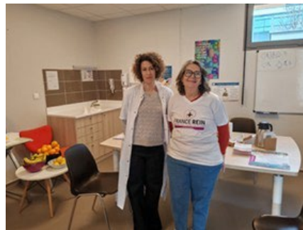
Clinique Mutualiste du Médoc à Lesparre (33)