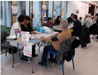
CH Layné de Mont de Marsan (40)