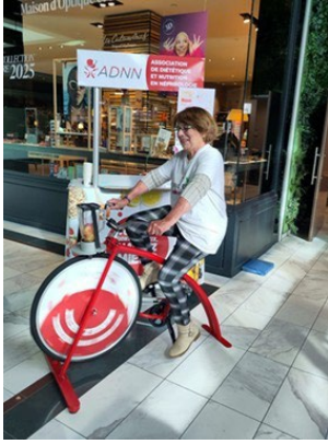
Vélosmoothie avec La Maison du Rein AURAD Aquitaine au Centre commercial Rives d'Arcins à Bègles (33)